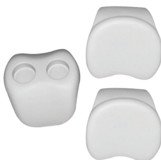
KIT CONFORT - RÉF : 31244