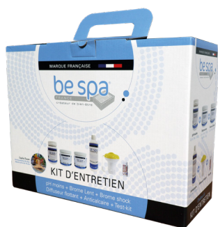
KIT CHIMIE BROME - RÉF : 143145F