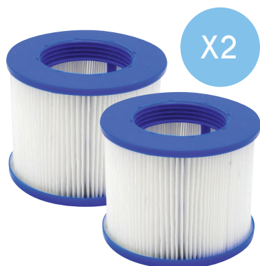
FILTRE - RÉF : FL31220